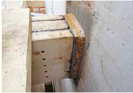
▲ Der Zuganschluss Gurtholz ist in Längsrichtung ausgeführt