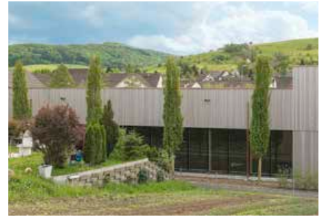
▲ Trotz seiner Größe fügt sich das Gebäude gut in die hügelige Landschaft ein