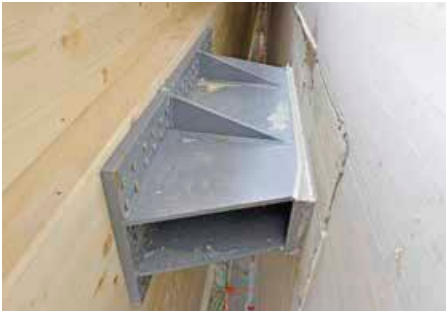
▲ Der Schubanschluss verläuft in Querrichtung