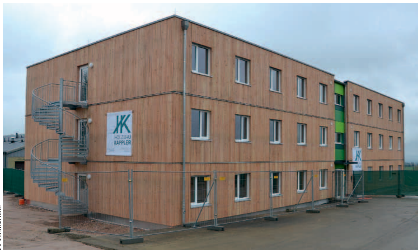
Dieser hölzerner Dreigeschossiger am Flughafen Hahn/Hunsrück beherbergt seit wenigen Wochen Flüchtlinge aus Kriegsgebieten. Vom ersten Entwurf bis zur Fertigstellung vergingen nur 75 Tage.

Flüchtlingsunterkünfte | Im Moment entsteht in vielen Orten Deutschlands schneller Wohnraum zur Unterbringung von Flüchtlingen – häufig in hölzerner Bauweise. Das zuständige Ministerium in Rheinland-Pfalz initiierte einen Holzbau in rekordverdächtiger Zeit – und vereinbarte gleichzeitig mit dem ausführenden Architekten und Holzbauer Holger Kappler und Tobias Götz (Ingenieurbüro Pirmin Jung), deren Baupläne für Wiederholungsbauten zur freien Verwendung zu veröffentlichen. Markus Langenbach